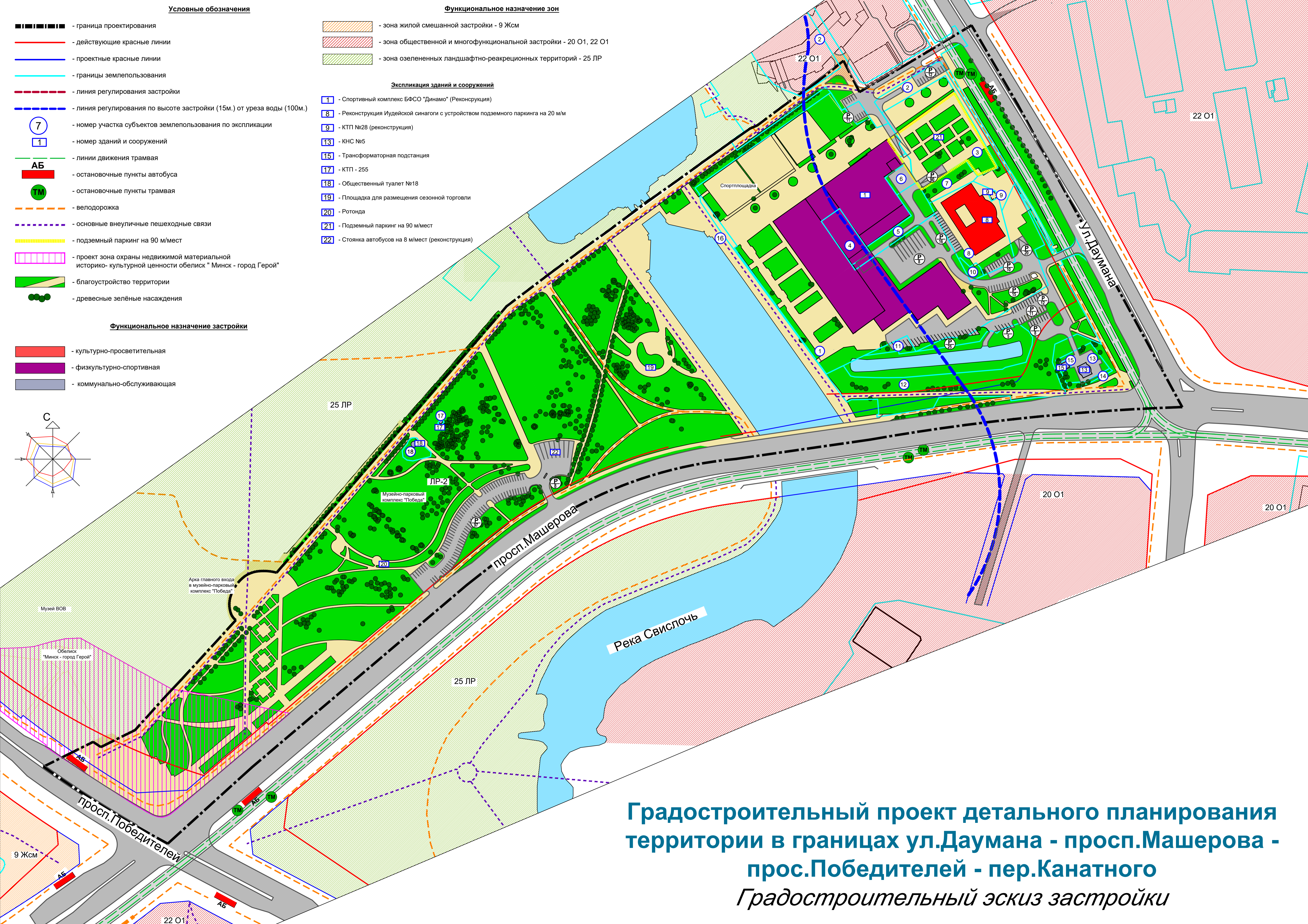
Градостроительный проект детального планирования территории в границах ул.Даумана - просп.Машерова - просп.Победителей - пер.Канатного Градостроительный эскиз застройки